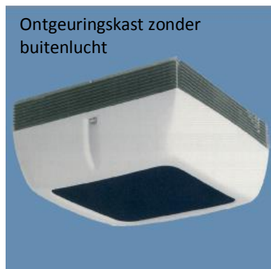
Ontgeuringskast zonder buitenlucht

Een andere belangrijke eis is dat er een (mechanische) ventilator aanwezig moet zijn om de lucht te verversen. Deze moet op de buitenlucht zijn aangesloten. Ook daaraan zijn eisen verbonden. De formule die in het Besluit eisen inrichtingen Drank- en horecawet staat, is in de praktijk lastig te gebruiken. Het is gemakkelijker om ervan uit te gaan dat de ventilator de ruimte van een lokaliteit per uur zes keer moet voorzien van lucht van buitenaf.